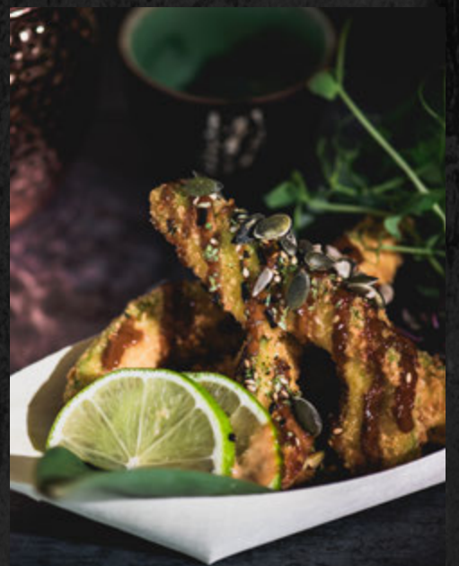
Avocat Panko 4 pcs / 7,90 €