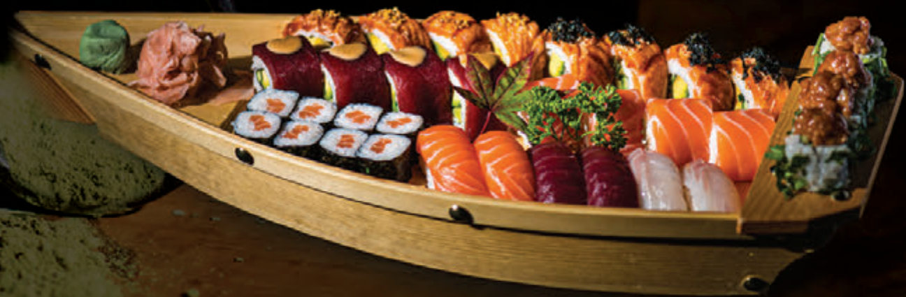
GOURMAND / 55 € Assortiment 34 pcs