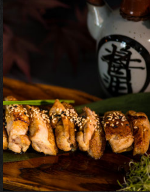
Poulet Teriyaki / 14,90 €