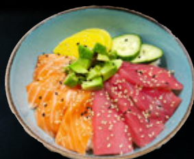
Chirashi Thon Saumon 17,90 €