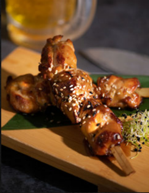
Yakitoris poulet 4pc 14,90 €