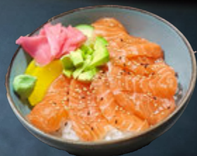
Chirashi Saumon 16,90 €