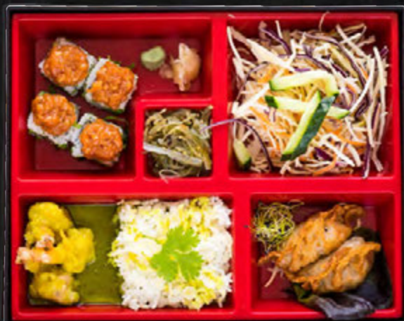
Curry vert/ 24,90 €