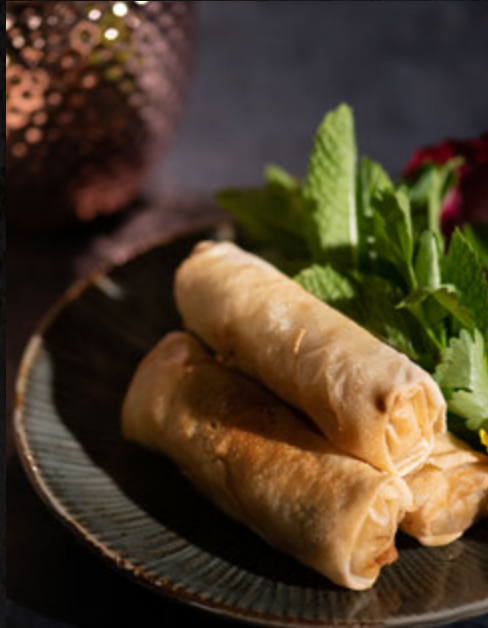
Rouleaux poulet 3 pcs / 6,90 €