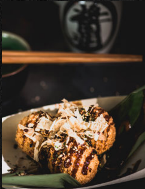
Bouchée au saumon 3 pcs / 6,5 €