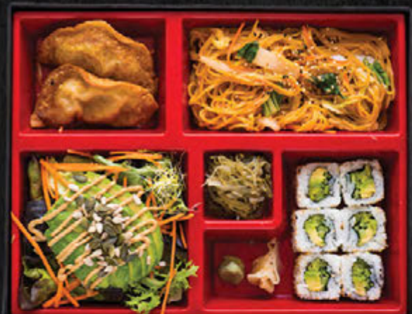
Végétarien / 19,90 €