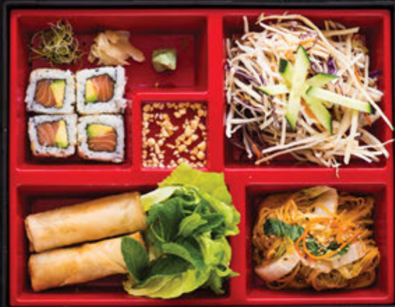
Harumaki / 17,90 €