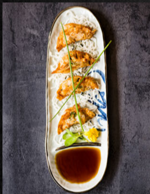
Gyozas [porc ou végé] 4 pcs / 6,90 €