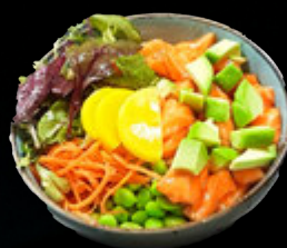
Bol Saumon 17,90 €