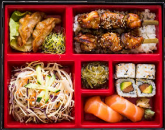
Yakitori / 21,90 €