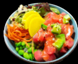
Bol Thon miso yuzu 18,90 €