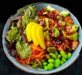
Bol Saumon épicé 18,90 €