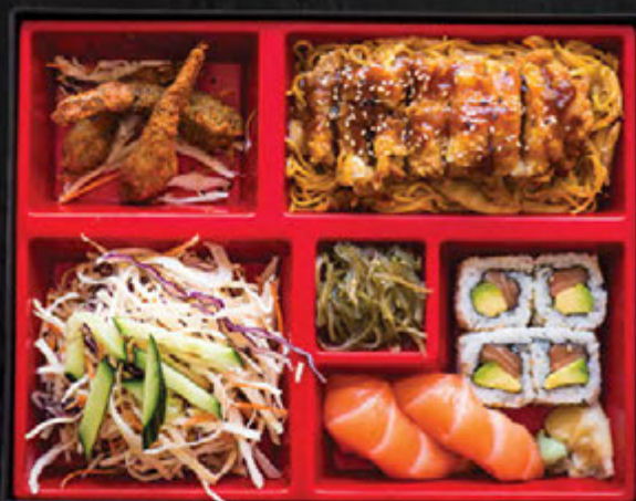
Poulet yakisoba / 23,90 €