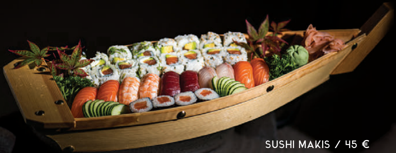
SUSHI MAKIS / 45 € Assortiment 30 pcs