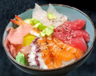
Chirashi du Chef 18,90 €