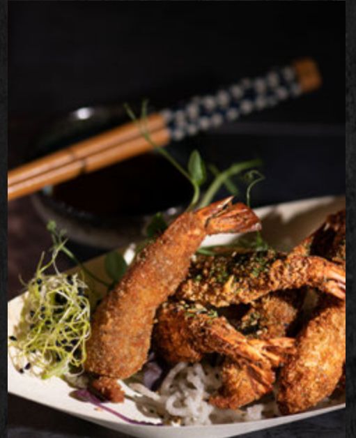
Beignets crevettes 4 pcs 7,90 €