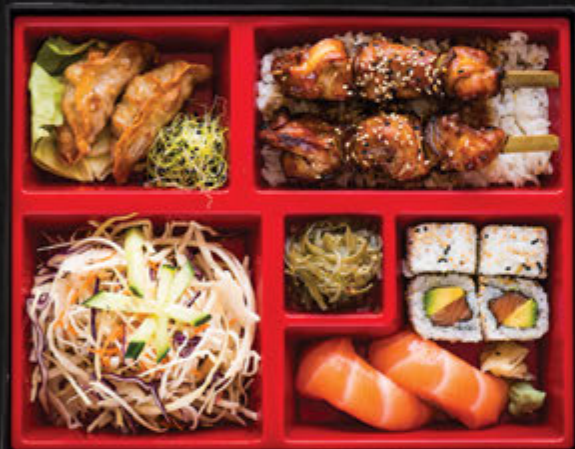
Yakitori / 21,90 €