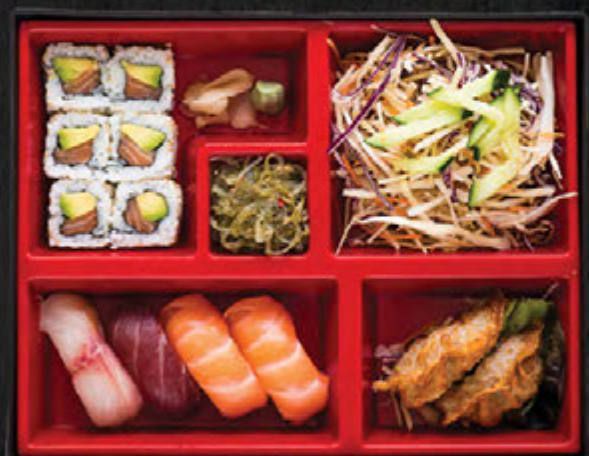
Sushi Maki / 23,90 €