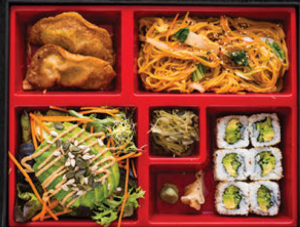
Végétarien / 17,90 €