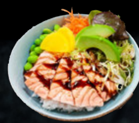
Bol Saumon Tataki 18,90€