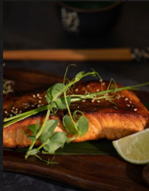
Saumon Teriyaki / 17,90 €