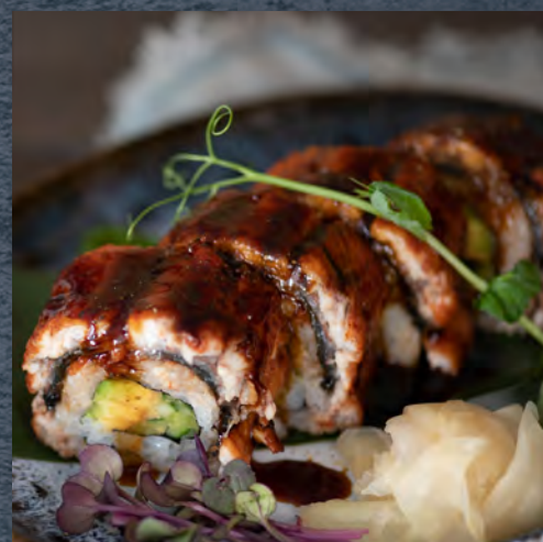
Anguille fumée uramaki / 12 €