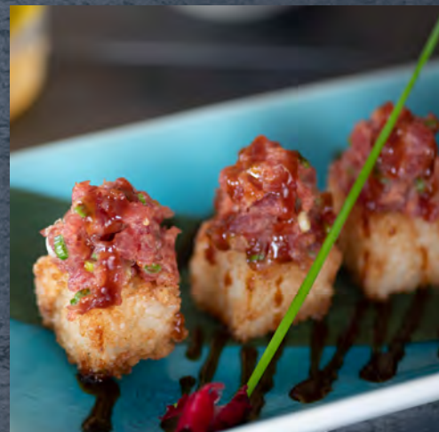
Riz croustillant Tartare de thon sésame / 9,50 €