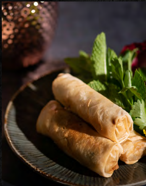
Rouleau poulet 3 pcs / 6,90 €