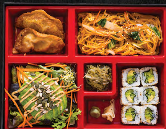
Végétarien / 19,90 €