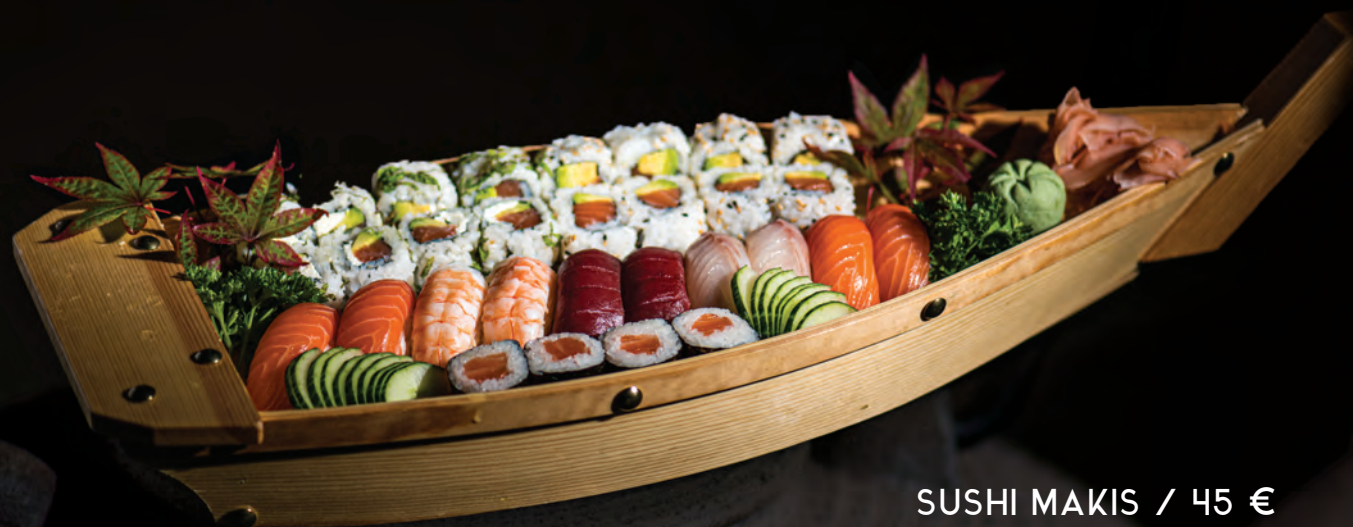
SUSHI MAKIS / 45 € Assortiment 30 pcs