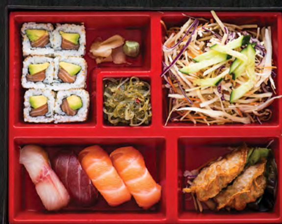
Sushi Maki / 23,90 €