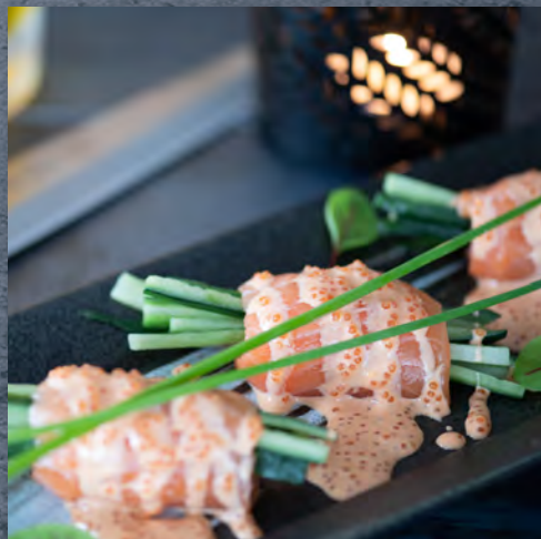
Saumon et concombre en fagot, sauce épicée / 7,50 €