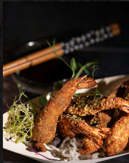
Beignets crevettes 4 pcs 7,90 €