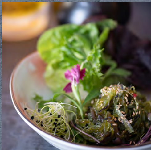
✔ Salade Wakamé / 6,90 €