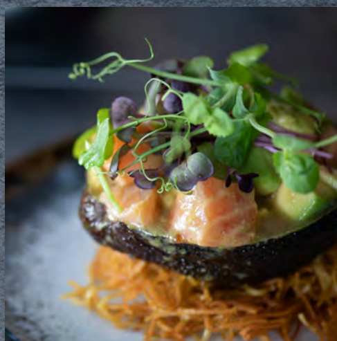
Tartare de saumon avocat yuzu / 9,90 €