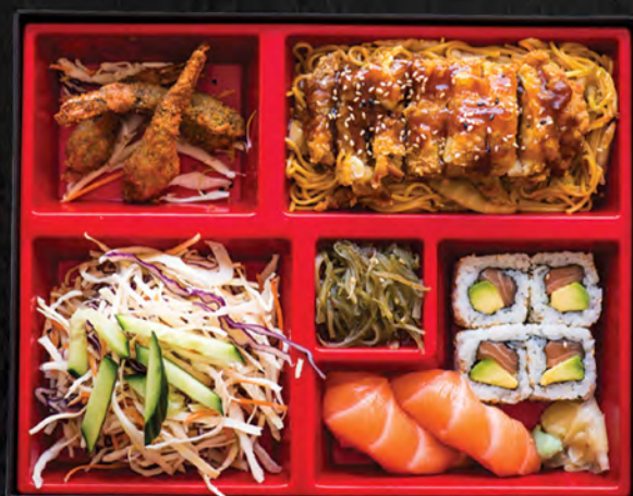
Poulet yakisoba / 23,90 €