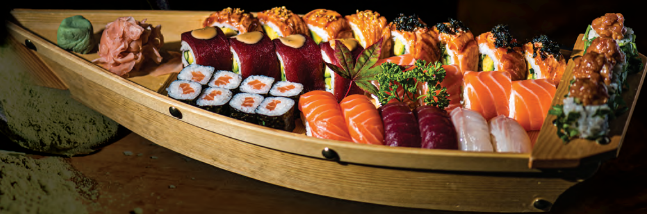
GOURMAND / 55 € Assortiment 34 pcs