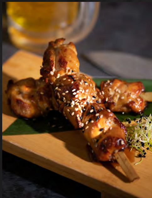
Yakitoris poulet 2 pcs / 7 €