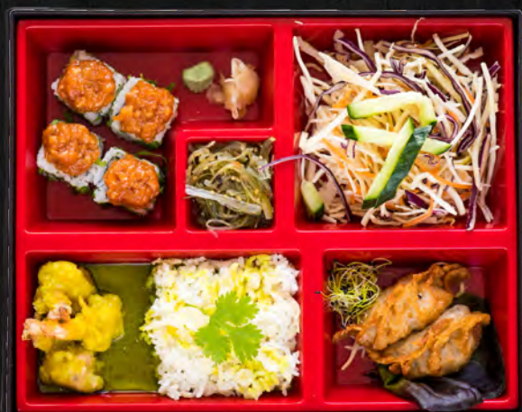
Curry vert/ 24,90 €