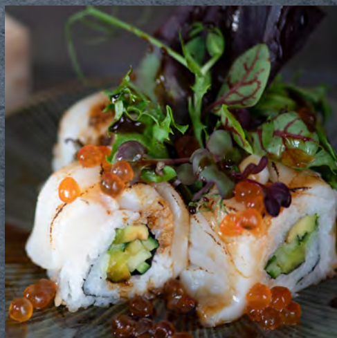
Saint-Jacques snacké uramaki / 12 €