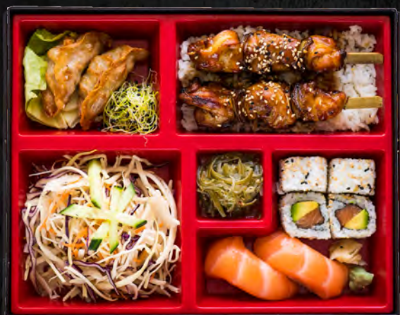
Yakitori / 21,90 €