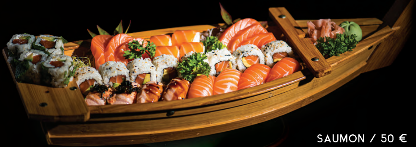
SAUMON / 50 € Assortiment 30 pcs