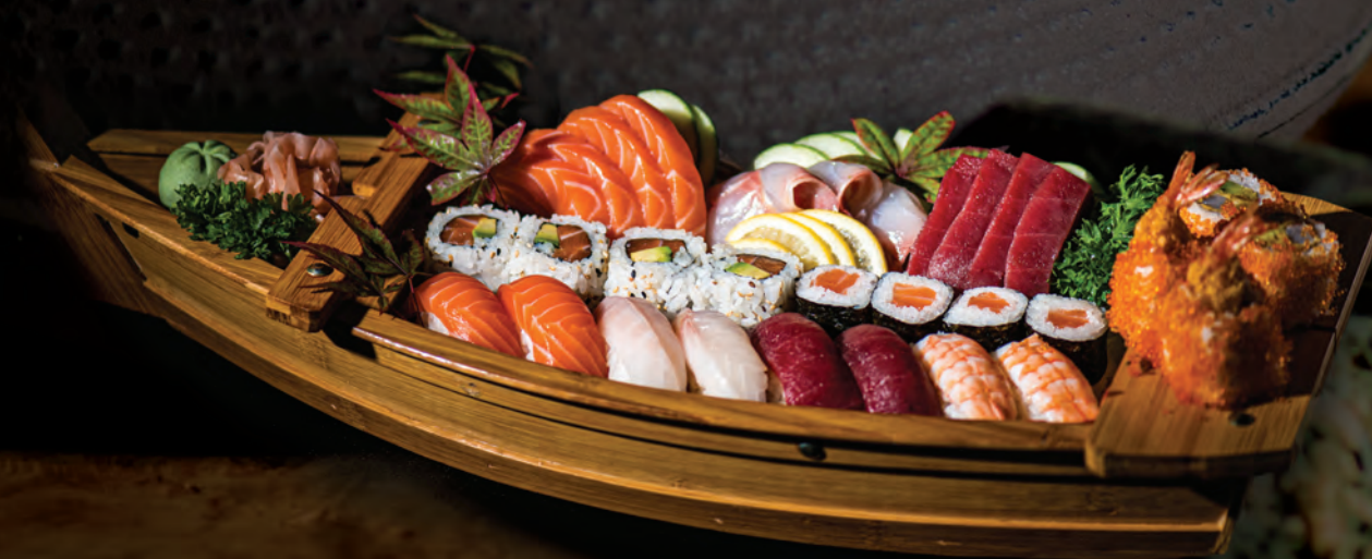
MIXTE / 49 € Assortiment 32 pcs