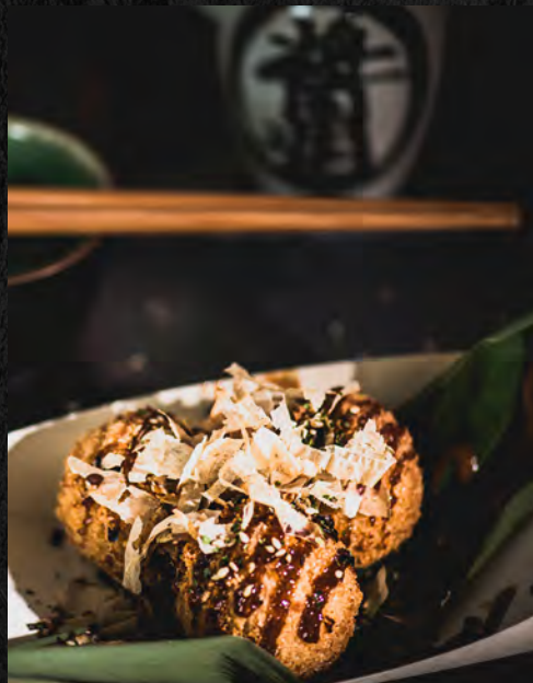
Bouchée au saumon 3 pcs / 6,5 €