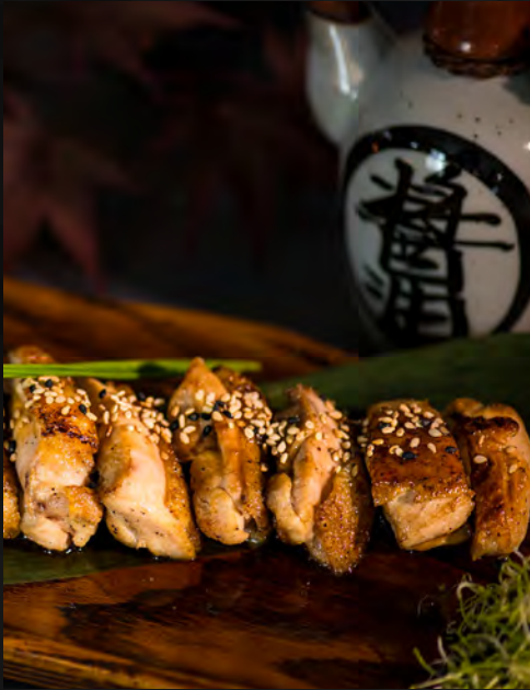
Poulet Teriyaki / 12 €