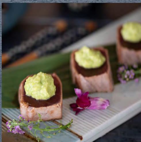
Tataki de thon purée d'avocat / 12 €