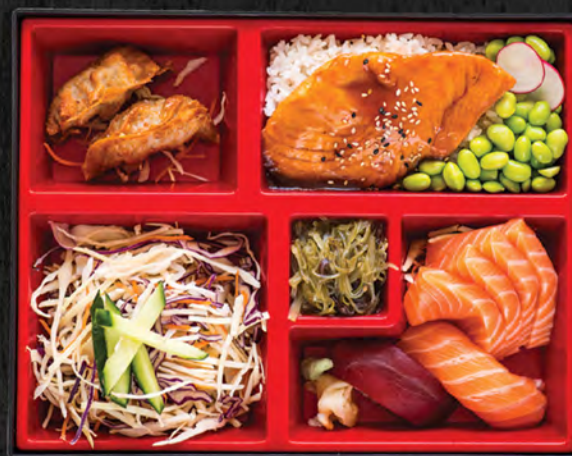
Chef / 25,90 €