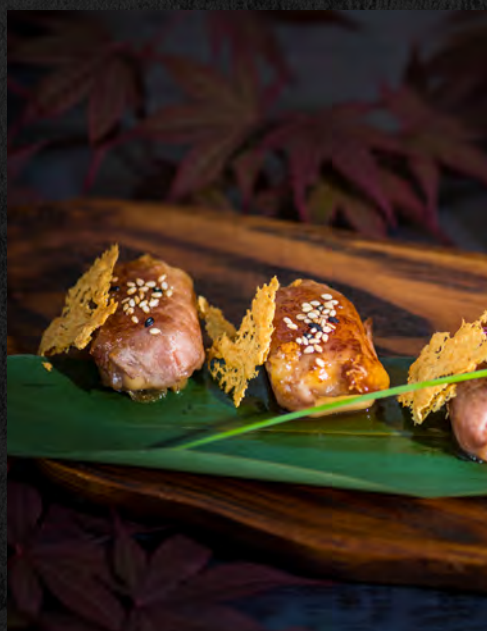
Boeuf fromage 4 pcs / 8,90 €